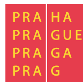
Magistrát hlavního města Prahy